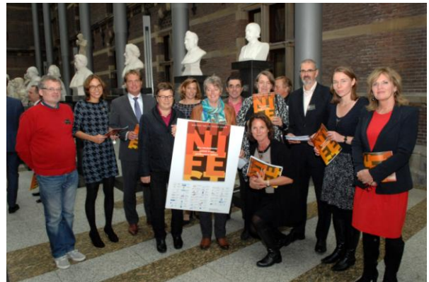
aanbieding van het Manifest 'Een meedenkende patiënt is een goedkope(re) patiënt'

Door samen te werken met andere patiëntenorganisaties participeren wij toch in enkele belangrijke projecten. We nemen zelf initiatieven, zodat patiëntenparticipatie verzekerd is. Dit gebeurt soms met grote persoonlijke offers. Op 15 oktober 2013 boden wij samen met collega- patiëntenorganisaties de Commissie VWS van de Tweede Kamer een Manifest aan waarin wij vragen om meer mogelijkheden en faciliteiten voor patiëntenparticipatie.