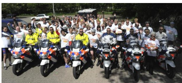
het peloton ME-ers, 12 mei 2009

De specialist van het CVS/ME Centrum, die voor dit project de patiënten selecteerde en de ontwikkelde test zou gaan toepassen, werd uit het BIG-register geschrapt.