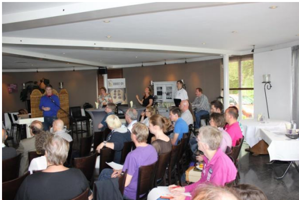
Landelijke ME informatiedag 8 mei 2013 in De Molenplas, Haarlem

De ME Vereniging Nederland is dit jaar gegroeid van 67 leden naar (tot nu toe) 90 leden en 17 donateurs, een groei van 60%. Het aantal vrijwilligers verdubbelde van 4 naar 8. Ook de activiteiten zijn uitgebreid. Op 8 mei vond in Haarlem de Landelijke ME informatiedag plaats, met lezingen door drie artsen, een infomarkt, en de eerste werkbepreking over de Richtlijn ME. Onder de titel Wetenschap voor patiënten zijn twee van de lezingen, evenals twee interviews, terug te vinden op het YouTube-kanal DossierME.